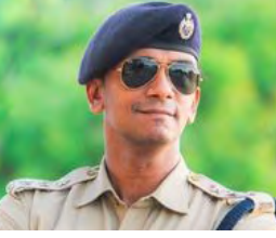
SP திரு.ஹர்ஷ் சிங் IPS